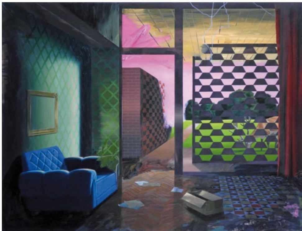
→ Hermann Reimer // Botschaft // 2020 // Öl auf Leinwand // 115 x 150 cm ← ← Abbildung Vorderseite: Hermann Reimer // Call // 2020 // Öl auf Leinwand // 130 x 100 cm