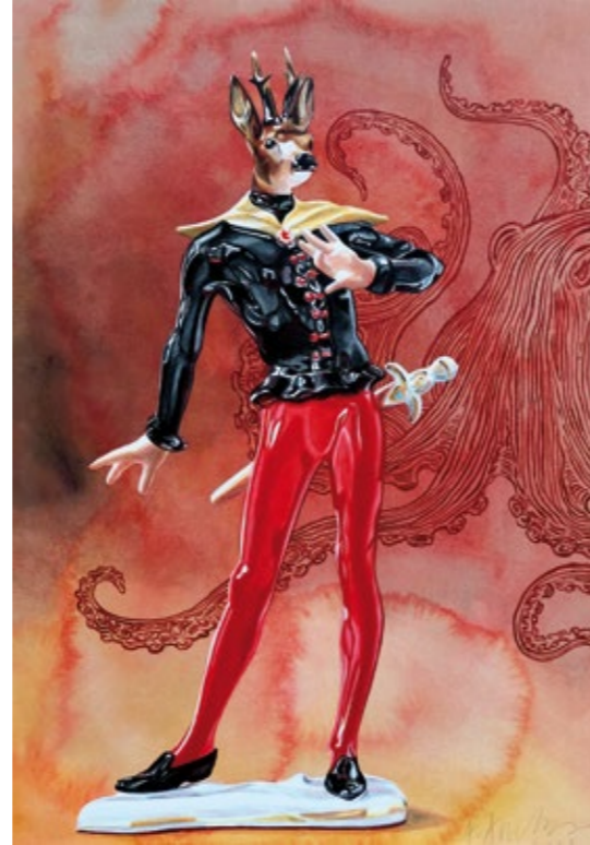
→ Andreas Amrhein // Mephisto XX (Rehbock) // 2022 // Acryl auf Büten // 70x50cm