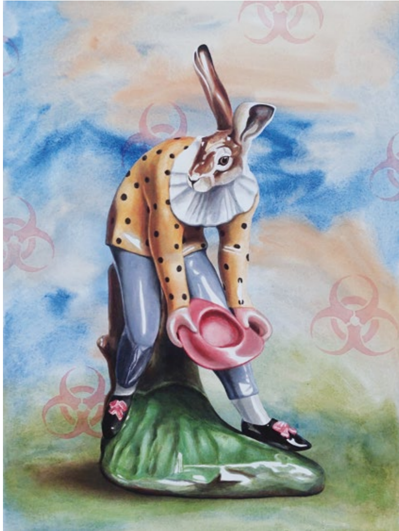
→ Andreas Amrhein // The Sire of Sorrow (Hase) // 2022 // Acryl auf Büten // 70x50cm ← ← Abbildung Vorderseite: Andreas Amrhein // The Arrival of Spring (Rehdame) // 2022 // Acryl auf Büten // 70x50cm