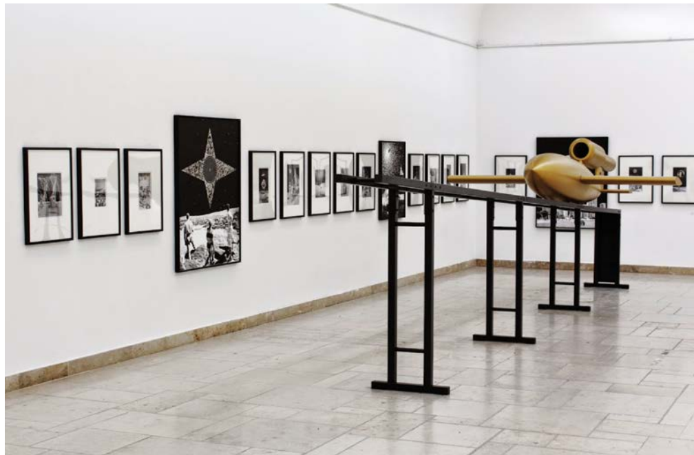
→ STUDY FOR THE AESTHETICS OF EVIL Eisen, Holz, lackiert // Länge 12m, Breite 2,80 // 2015