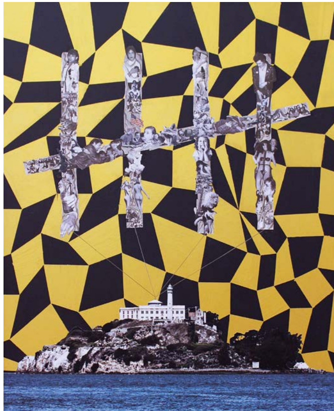
→ STUDY FOR THE UNIVERSE AS A NEVER-ENDING PRISON

Rost, Collage, Alkyd und Acryl auf Papier, auf Leinwand // 90 x 60 cm // 2016