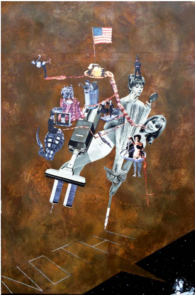
→ MONKEY PAINT A PICTURE ABOUT HOW IT'S GONNA BE

Rost, Collage, Alkyd und Acryl auf Papier, auf Leinwand // 90 x 60 cm // 2016