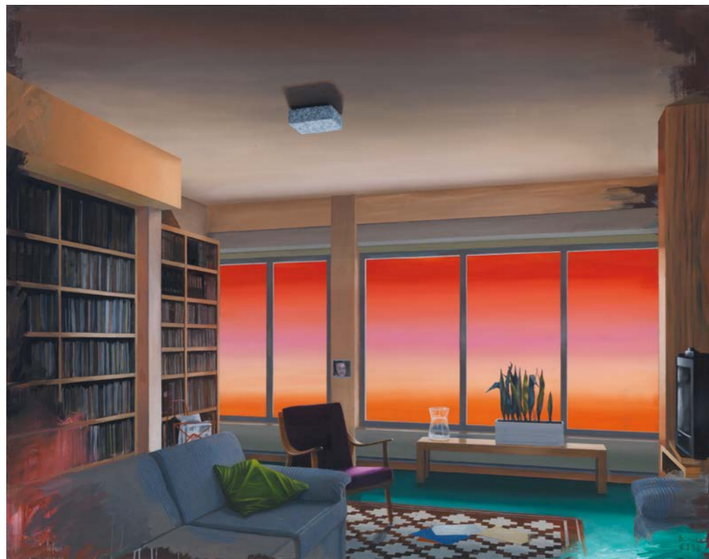
→ Hermann Reimer // CREPUSCULUM ÖL auf Leinwand // 130 x 165 cm // 2012